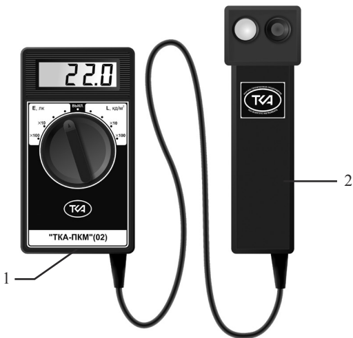
Рис.1. Внешний вид прибора “TKA-ПКМ”(02)