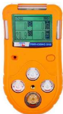
в) модификация ТОП-СЕНС 310