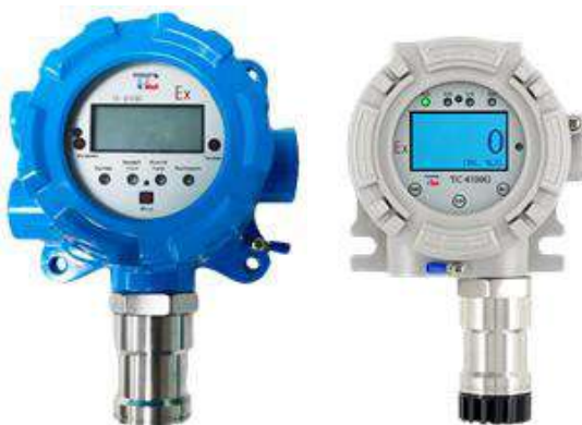
л) модификация ТОП-СЕНС 4100 G