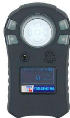
б) модификация ТОП-СЕНС 260