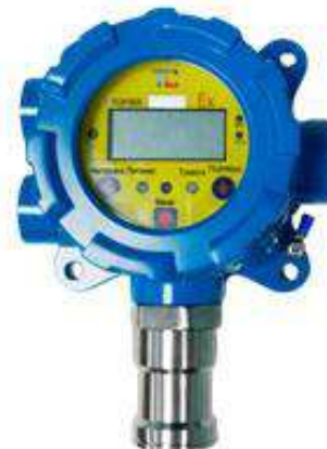
м) модификации ТОП-СЕНС 4100 S