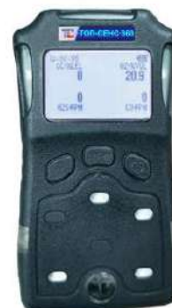
г) модификация ТОП-СЕНС 360