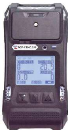
д) модификация ТОП-СЕНС 380