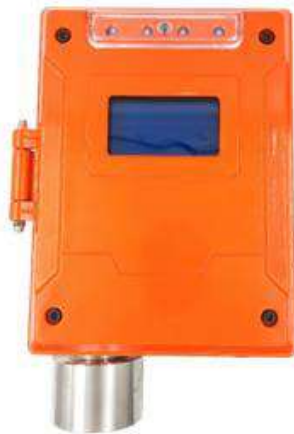
и) модификация ТОП-СЕНС 1000