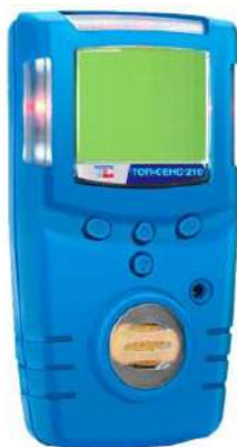
а) модификация ТОП-СЕНС 210

Общий вид газоанализаторов представлен на рисунке 1.