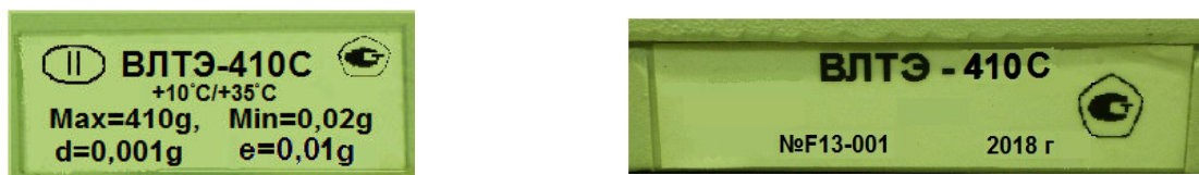
Рисунок 4 – Маркировка весов

Серийный номер и буквенно-цифровое обозначение весов приведены на двух табличках, закрепленных на корпусе весов методом наклейки.