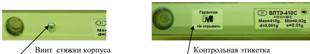
Рисунок 2 - Схема пломбирования от несанкционированного доступа

Для защиты весов от несанкционированной настройки и вмешательства, которые могут привести к искажению результатов измерений, весы пломбируются поверх одного винта стяжки корпуса контрольной этикеткой изготовителя. Схема пломбирования и обозначение места нанесения знака поверки представлены на рисунках 2 и 3, соответственно.